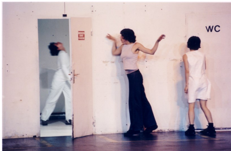
Abb. 2: Meg Stuart / Damaged Goods: Highway 101, 2000/2001 (Wien,)

Highway 101 nun ist kein geschlossenes Stück, sondern eine Kette von Ereignissen entlang eines Weges – wie der Begriff Highway ja auch andeutet. Dabei beschränkten sich dieser Weg und diese Begehung nicht etwa auf das Theatergebäude in Zürich, sondern erstreckten sich auf verschiedene Stätten und Städte. Begonnen wurde das Projekt im Jahr 2000 in Brüssel, wo Stuart und ihre Kompanie Damaged Goods noch heute beheimatet sind, dann ging es nach Wien, Paris, Rotterdam und eben Zürich. Choreografin und Tanzende lassen sich von den jeweiligen Räumlichkeiten inspirieren und schreiben ihnen dann passende oder aber gerade störende Bewegungen und Szenen ein. [Abb. 2]