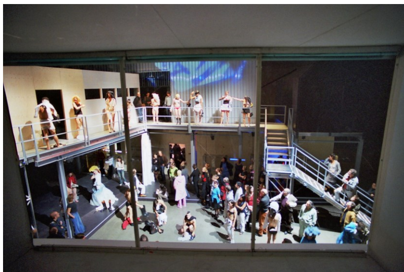
Abb. 3: Sasha Waltz & Guests: insideout , 2003

Das letzte Beispiel dieses Beitrags geht in der Aneignung von Räumen noch in eine weitere Richtung. Die Berliner Choreografin Sasha Waltz hat sich und ihrem Tanz bisher verschiedenste Räume erschlossen: von den Sophiensaelen über die Allee der Kosmonauten zu etablierten Theater- und Opernhäusern, verschiedenen prestigeträchtigen Museen und Musiktempeln bis zu Abbruchpalästen. Ich persönlich finde Waltz' Raumerschließungen nicht alle gleichermaßen geglückt. Das Projekt Insideout allerdings im Hinblick auf das Thema „Bewegliche Räume“ und auf die Beispielreihe, die dieser Beitrag entwirft, durchaus interessant, auch weil es wiederum exemplarisch für ähnliche Arbeiten angesehen werden kann. [Abb. 3]