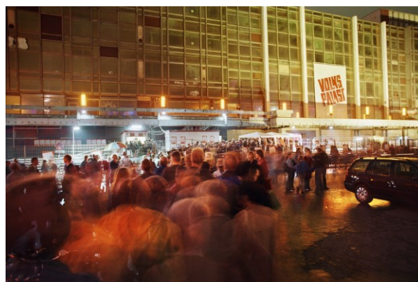
Abb. 3: Eröffnung ZwischenPalastNutzung / Volkspalast Berlin, Berlin (2005)

Das Konzept bestand darin, einen Staffellauf der Ideen und Kurator*innen zu produzieren: Keiner sollte dauerhaft den Ort bespielen dürfen. Es sollte kleine und monumentale Veranstaltungen geben. Das Ende war vorgegeben. Temporalität – tausend Tage – war dem Projekt eingeschrieben. Die historische Aufladung des Ortes sollte überschrieben und transformiert werden. Aus dem transitorischen Ort sollten Ideen für die Zukunft des Geländes generiert und auch ein Modell für eine kulturelle Vision des 21. Jahrhunderts geschaffen werden. Im Volkspalast 2004–2005 gab es Programme von Hochkultur bis Sub- und Clubkultur, Sportveranstaltungen, Kongresse, Konzerte und Partys. [Abb. 3–6]