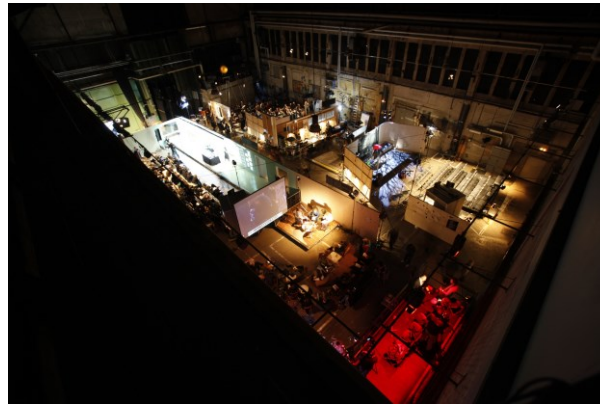
Abb. 9: Die Untoten von Hannah Hurtzig, Kampnagel Hamburg (2011).

Das Kampnagel-Gelände wird nicht als Umgebung passiv hingenommen, sondern als Raum aktiv genutzt, um Austausch zwischen den Künstler*innen und dem Publikum zu provozieren. Hierfür werden Formate entwickelt wie der Sommer- bzw. Kunstgarten Avant Garten , eine Sauna oder ein Pool, ein künstlerisch bespielter Hamam, lange Tafeln zum Festmahl für das Publikum, Installationen für Kongresse oder Schlafinstallationen u.v.m. Auch Interventionen im öffentlichen oder halb-öffentlichen Raum gehören selbstverständlich zum Kampnagel-Programm.