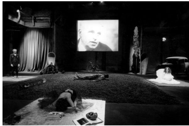
Abb. 1: Das Blau des Himmels von Ivan Stanev, Sophiensaele, Berlin (2000)