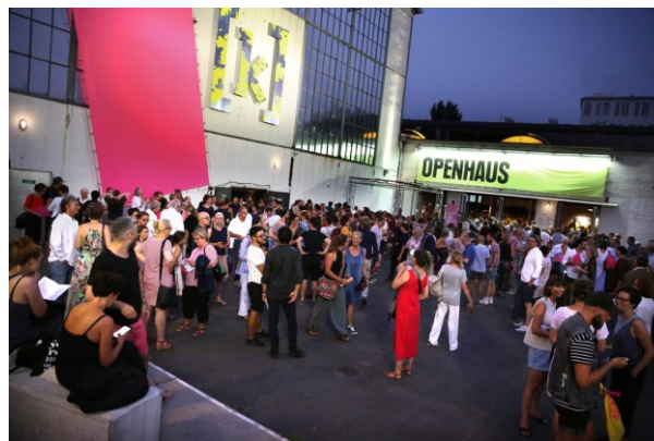
Abb. 7: Eingang mit Vorplatz, Kampnagel Hamburg

Kampnagel ist eine stillgelegte Kranfabrik, die 1982 nach sogenannten Besetzungsproben durch freischaffende Künstler*innen Hamburgs in ein Kunstzentrum umgewandelt wurde. Ab 2007 wurde das etwas in die Jahre gekommene Zentrum neu justiert: Die Grundidee war, die Visionen der Pioniere und Zwischennutzer*innen aus der Nachwendezeit mit denen einer Institution zusammenzuführen in einer spielerischen Anknüpfung an die Besetzungsgeschichte und ihrer Transformation. Die Öffnung des Geländes und der Hallen für unterschiedliche Disziplinen und Nutzungen sowie die Bespielung des Außengeländes und unterschiedlicher Stadträume sind seit 2007 Teil der kuratorischen Strategie. [Abb. 7–9]