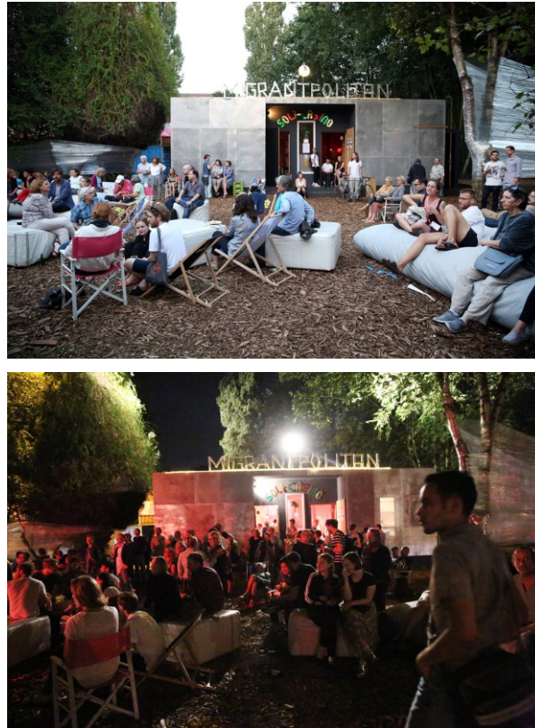
Abb. 10/11: Migrantpolitan, Kampnagel Hamburg (2015).

von Baltic Raw und Kampnagel betrieben. Es war Werkstatt, Probenraum, Küche, Communityraum zugleich und brachte es – nicht nur wegen einer Strafanzeige der AfD – zu einiger Berühmtheit. Nach dem Projektzeitraum von sechs Monaten wurde die EcoFavela in das Migrantpolitan transformiert, einen autonomen Kunstraum, der von und mit Geflüchteten, Teilen der Kampnagel-Dramaturgie, Neu- und Althamburger*innen, Migrant*innen und der Hamburger Künstler*innen-Szene als offener und ganztagig zugänglicher Raum unabhängig betrieben wird. [Abb. 10–11]