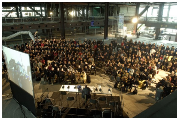
Abb. 5: Fun Palace ZwischenPalastNutzung / Volkspalast Berlin, Berlin (2004)