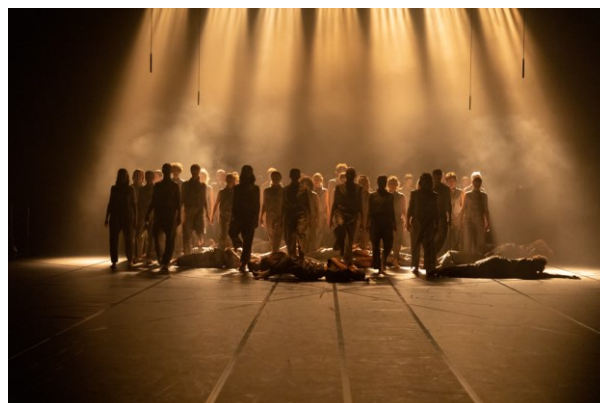
Abb. 8: Emergenz Uraufführung von Jose Vidal, Kampnagel Hamburg (2019).