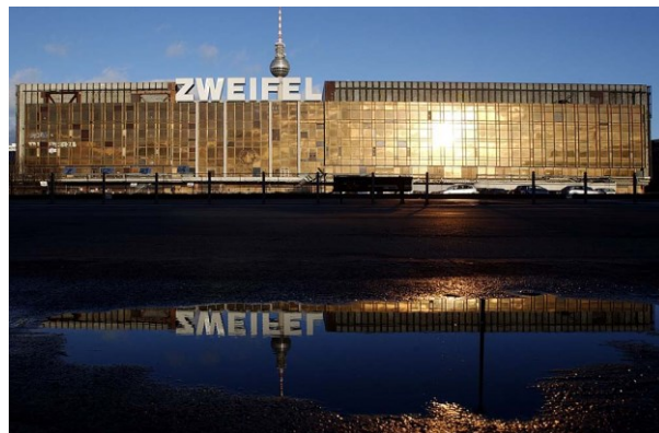
Abb. 6: Zweifel ZwischenPalastNutzung / Volkspalast Berlin, Berlin (2005)

Der Volkspalast war eine offene Plattform, in der multiple Stimmen zugelassen wurden – ein Labor für eine neuartige Polyphonie. Ein hergestelltes, produziertes, geplantes Labor, das die Berliner Zwischennutzer*innen einbezog und gleichzeitig die Forschungen von Philipp Oswalt zum Potential von Zwischennutzungen für die Stadtentwicklung in das Konzept einfließen ließ. Somit war dieses