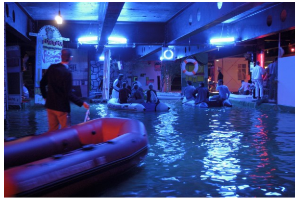
Abb. 4: Fassadenrepublik ZwischenPalastNutzung / Volkspalast Berlin, Berlin (2004)